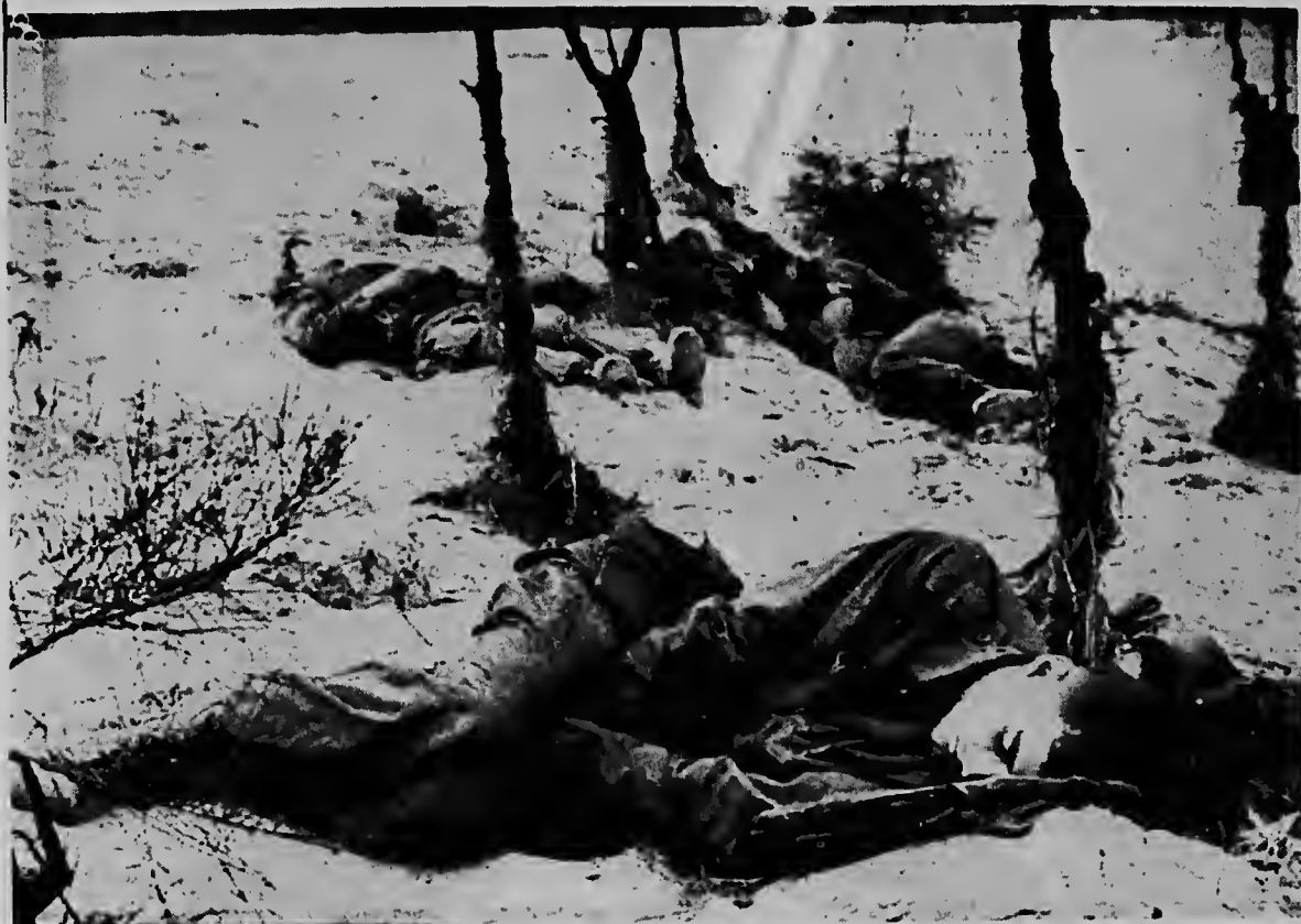
Cansá di tantu lucha, e soldanan mericano aki a benta nan curpa na suela pa drumi algun minuut durante un campaña reciente contra Viet Cong. Durante e campaña aki, ambos banda a sufrí perdida mientras qu e mericanonan a captura diferente guerrillero.